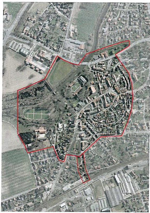
Abgrenzung Stadtumbaugebiet „Integriertes Handlungskonzept Innenstadt Drensteinfurt“, vergleiche auch Gebietskulisse „ISEK“, Seite 9.