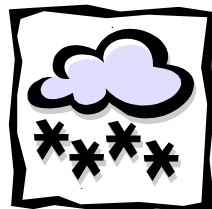
Hoffentlich: Viel Schnee!